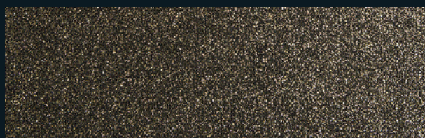
1910 Black with gold glitters