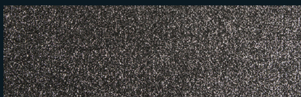
0910 Black with silver glitters